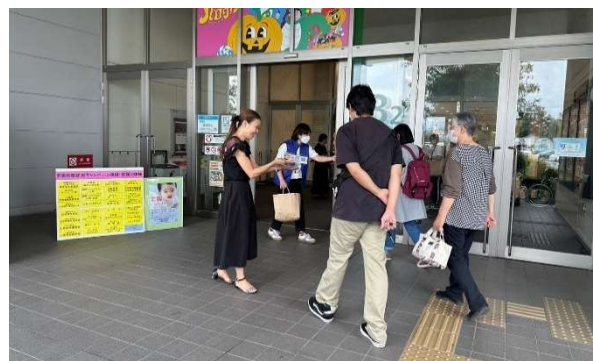
配布風景 (ほたる西入口)