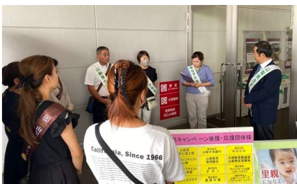
出発式 (ほたる西入口)