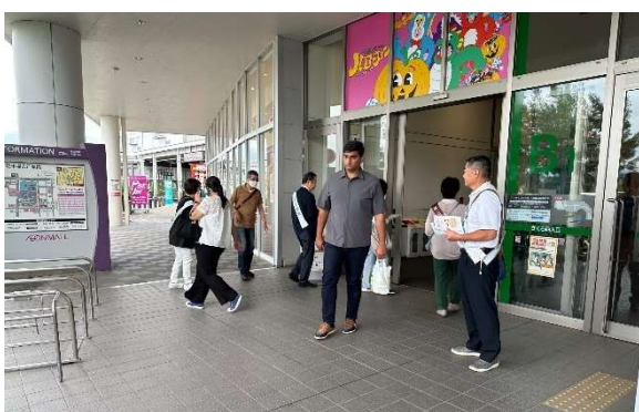
配布風景 (さくら西入口)