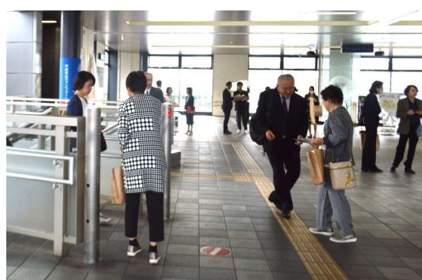
配布風景 (ペデストリアンデッキ)